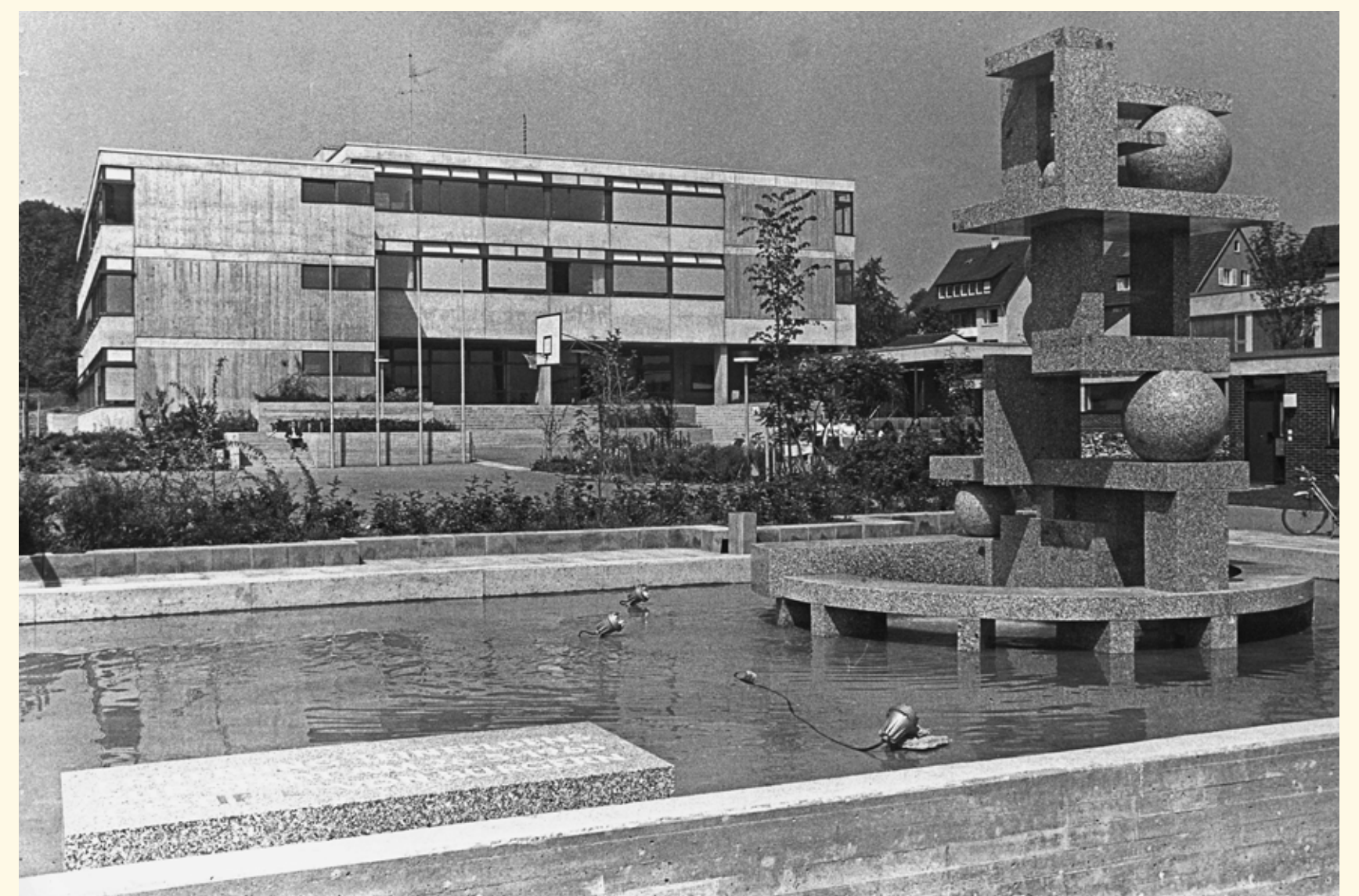
Der Stadtbrunnen vor der 1968 fertiggestellten Immanuel-Kant-Realschule, Aufnahme 1974