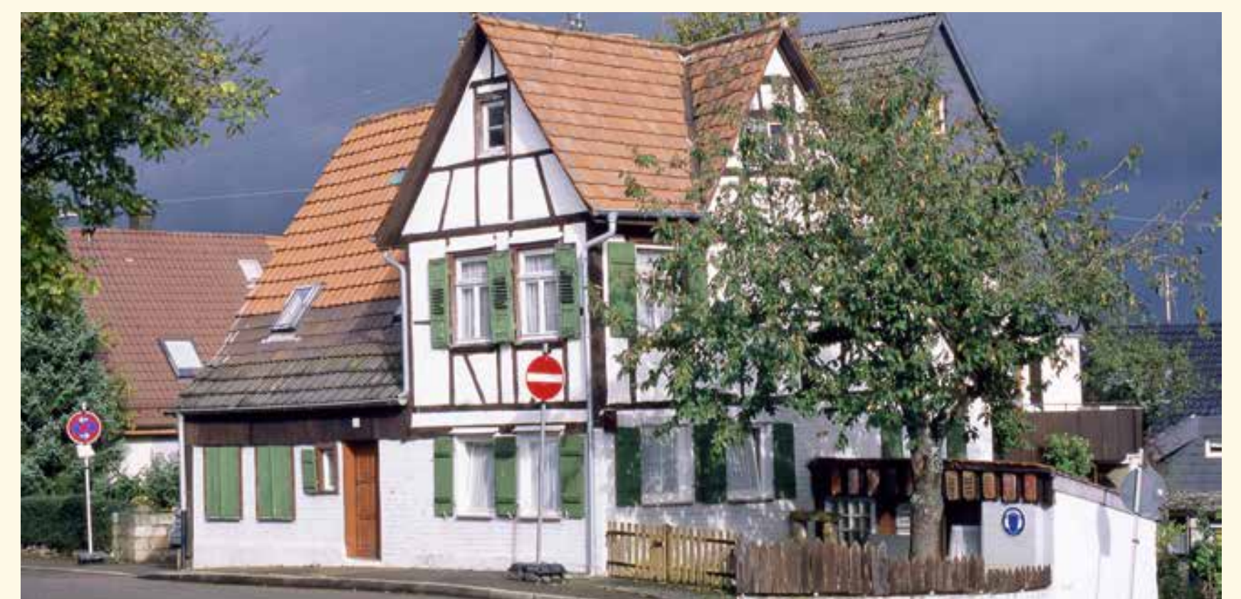
Oberdorfstraße 12, Aufnahme 2005