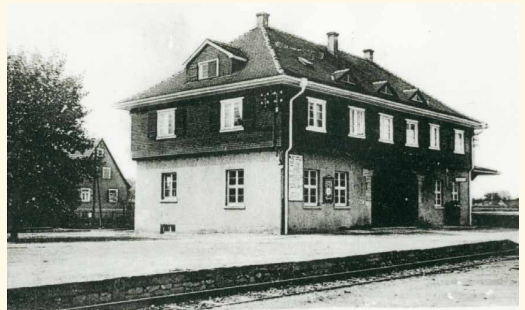
Bahnhof Leinfelden a. F.

Die Eröffnung der neuen Stadtbahnlinie U 5 erfolgte im Jahr 1990. Gleichzeitig wurde die Straßenbahnlinie nach Echterdingen eingestellt. Mit der Inbetriebnahme der S-Bahnlinien S 2 und S 3 über die 1993 neugebaute S-Bahn-Station Leinfelden zum Flughafen bzw. zur Messe begann ein neues Zeitalter für den Nah- und Fernverkehr.